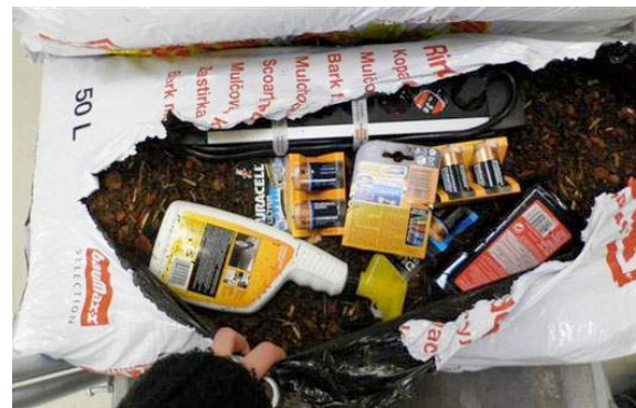
Hochwertige Ware in Billigware