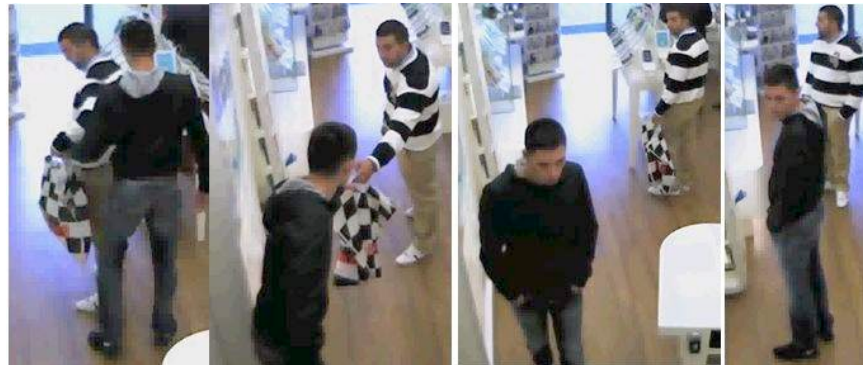
Profis / Banden