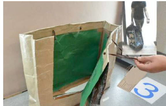
Präparierte Tragehilfe mit Alufolie