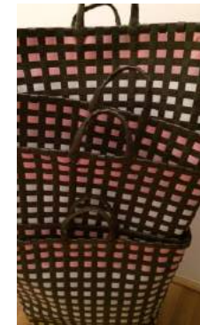
Ware in Ware: unterster Korb befüllt