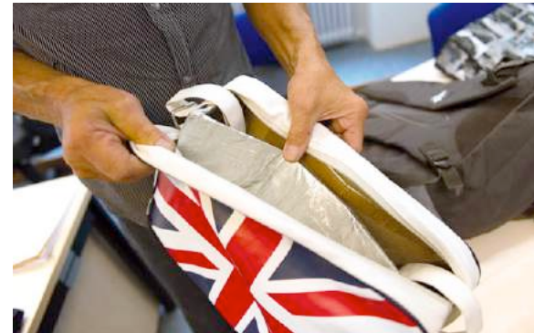
Präparierte Tragehilfe mit Alufolie: Warensicherungsanlage damit nicht aktiv!